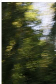
Illusion du mouvement

(*) audition février :mars 2021 au CCN de Créteil