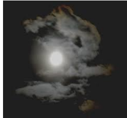
Clair obscur de lune