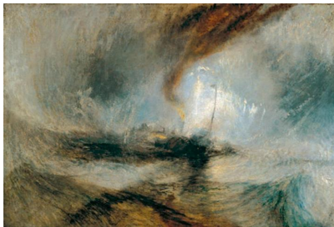
Zone d'ombre et de lumière – William Turner. Un bateau au loin ? une cathédrale à la dérive ?