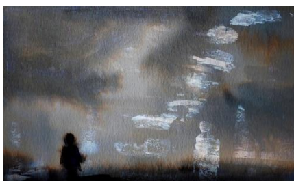
Histoire de fantômes -

Il collabore sur 2018 et 2019 à l'écriture/mise en scène pour des projets jeune public avec des compagnies de danse hip hop : cie Tensei (Ferney Voltaire) - Cie Shamploo (Genève).