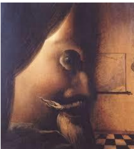
L'image disparaît – Dali